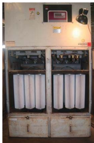
洗浄したフィルターの性能は新品同様 です! 集塵能力も驚くほど回復します!

目詰まりしたら洗浄リサイクルしまし よう。 フィルターは洗浄して何回でも使え ます。 フィルターは定期交換が基本です!