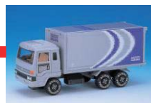
宅配便が配達いたします。