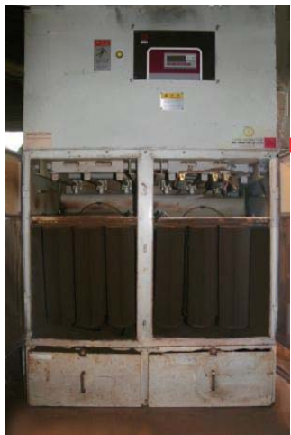
集塵機から目詰まりしたフィルターを取り外す