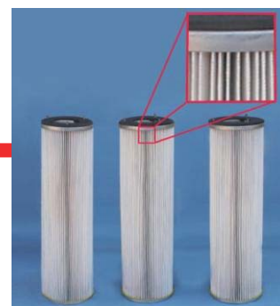
きれいになりました