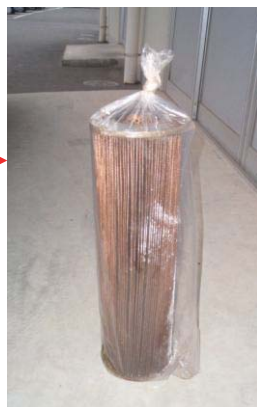
1本ずつビニール袋に入れて縛る