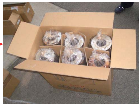
段ボールに入れて梱包する (なお、段ボールは粉塵が外に出ないようにしっかりガムテープで密封してください)