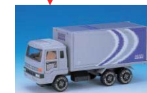
宅配便が集荷に伺います。