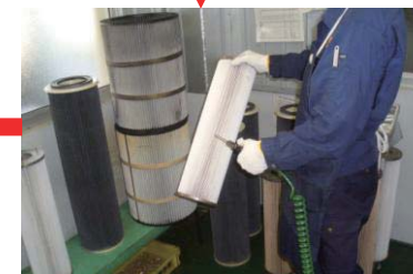
(株)群馬製作所で一生懸命洗います 90%以上の回復率です!